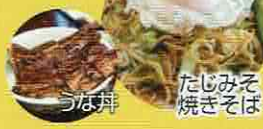
たじみそば 焼きそば